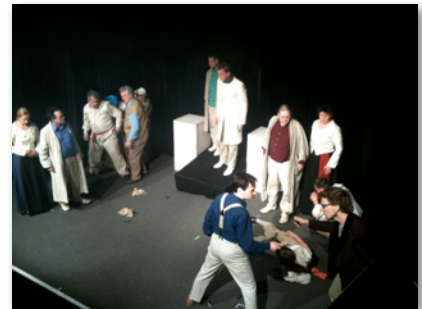
Magma "Romeo & Julia"

Gefolgt von weiteren Theaterstücken von Magma in den ersten vier Monaten.